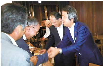
石原ひろたか後援会