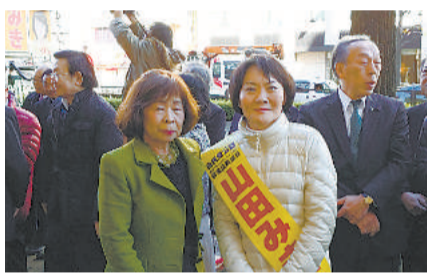
東京1区 山田美樹候補(自民党)