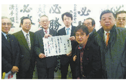
東京4区 平将明候補(自民党)