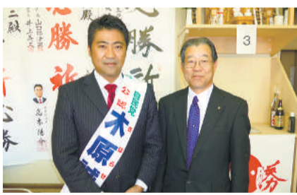
東京20区 木原誠二候補(自民党)