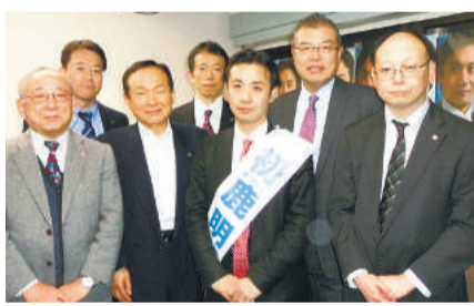
東京16区・比 初鹿明博候補(維新の党)