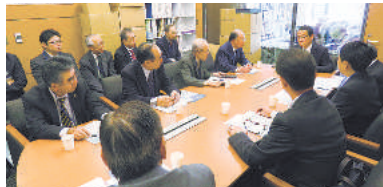
越智隆雄議員 (自由民主党・東京6区)