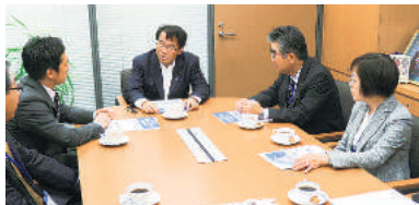
松原仁議員 (民主党・東京3区)

本連盟は11月9日、「軽減税率」の対象品目の線引きや「経理方式」導入等について、与党間での協議が続く中、陳情を行った。当日は、関係税理士後援会および単位税政連の協力を得て、議員事務所を訪問した。(※=10月29日実施)