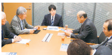
小倉将信議員 (自由民主党・東京23区)