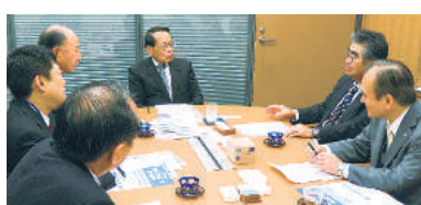
平沢勝栄議員 (自由民主党・東京17区)