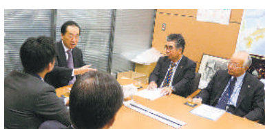
菅直人議員 (民主党・東京18区)