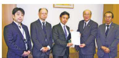
初鹿明博議員 (維新の党・東京16区)