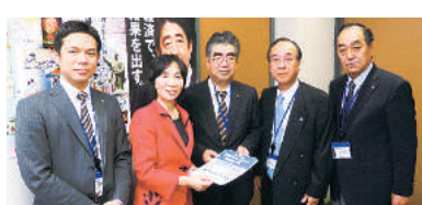
松島みどり議員 (自由民主党・東京14区)