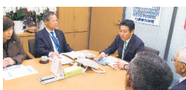
秋元司議員 (自由民主党・東京15区)