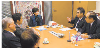
小池百合子議員 (自由民主党・東京10区)