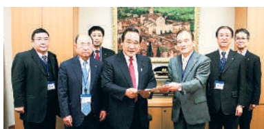
大西英男議員 (自由民主党・東京16区)