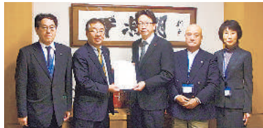
平将明議員 (自由民主党・東京4区)