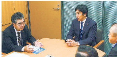
菅原一秀議員 (自由民主党・東京9区)