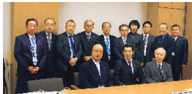
辻清人議員 (自由民主党・東京2区)