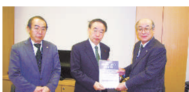
土屋正忠議員 (自由民主党・東京18区)