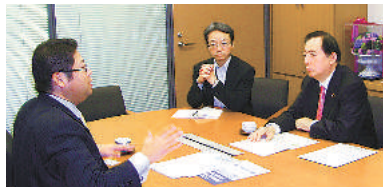
太田昭宏議員 (公明党・東京12区) ※