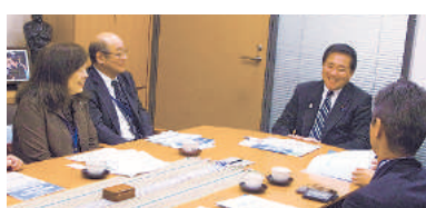
長島昭久議員 (民主党・東京21区)