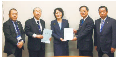
山田美樹議員 (自由民主党・東京1区)