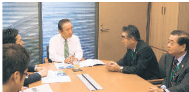
鴨下一郎議員 (自由民主党・東京13区)